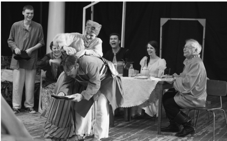
Рабочий момент репетиции