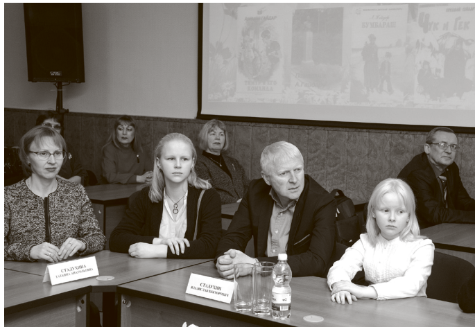
Родственники А. П. Гайдара.

Был в нашей истории момент, когда писатель Гайдар был изгнан из школы, вычеркнут из списков литературы для чтения, но благодаря энтузиастам, в том числе и арзамасским, это