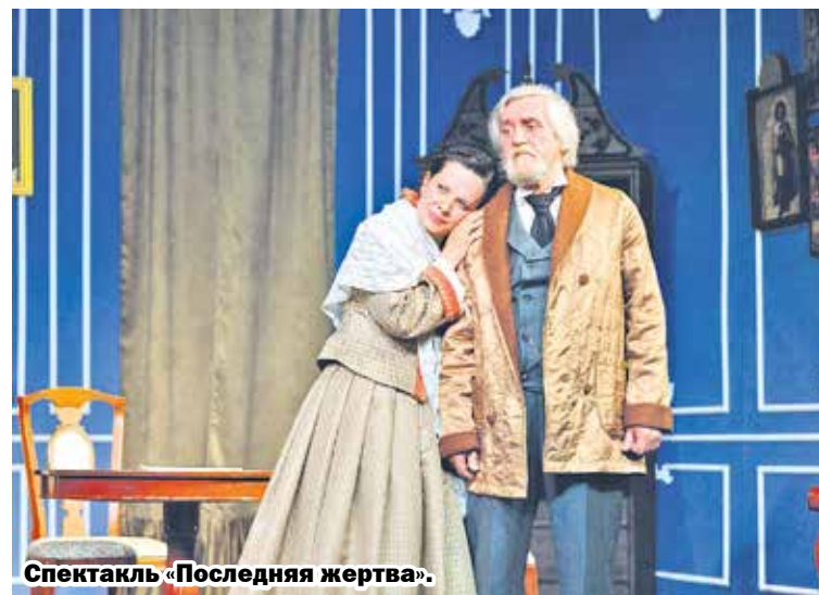
Спектакль «Последняя жертва».