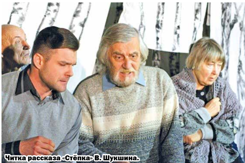
Читка рассказа «Стёпка» В. Шукшина.